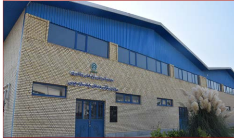
مجتمع آموزشی، پژوهشی و فناوری صنایع مبلمان و فرآورده‌های چندسازه چوبی زیربنا: ۱۶۸۰ مترمربع شروع: ۱۳۹۶ – بهره‌برداری: شهریور ۱۳۹۹