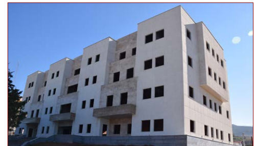
پروژه مجتمع آزمایشگاهی زیربنا: ۴۴۰۰ مترمربع شروع: ۱۳۹۳ – پیشرفت فیزیکی در سال ۱۳۹۹: ۵۰٪