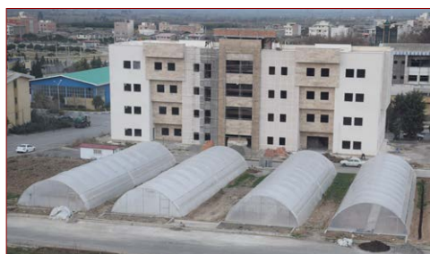
توسعه گلخانه‌ها مساحت: ۱۱۲۰ مترمربع شروع: ۱۳۹۷ – پیشرفت فیزیکی در سال ۱۳۹۹: ۶۵٪