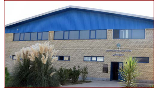
مجتمع آموزشی، پژوهشی و فناوری صنایع غذایی زیربنا: ۱۴۴۰ مترمربع شروع: ۱۳۹۶ – بهره‌برداری: شهریور ۱۳۹۹