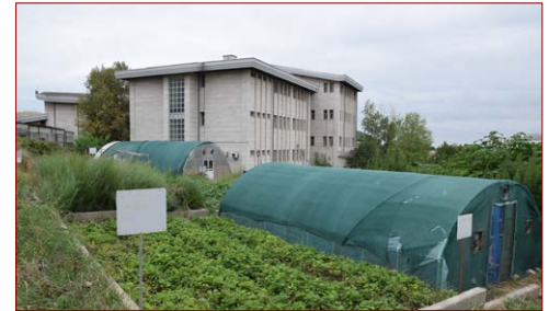
پارک کسب و کار دانشجویی مساحت: ۶۰۰۰ مترمربع شروع: ۱۳۹۵ – بهره‌برداری: شهریور ۱۳۹۹