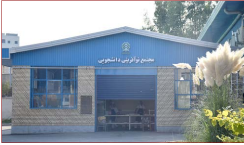
مجتمع نوآفرینی دانشجویی زیربنا: ۲۱۶ مترمربع شروع: ۱۳۹۶ – بهره‌برداری: شهریور ۱۳۹۹