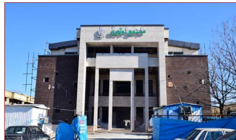
پروژه مجتمع نوآوری زیربنا: ۳۰۰۰ مترمربع شروع: ۱۳۹۶ – پیشرفت فیزیکی در سال ۱۳۹۹: ۹۰٪