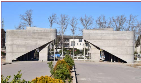
سردر پردیس جدید دانشگاه شروع: ۱۳۹۷ – پیشرفت فیزیکی در سال ۱۳۹۹: ۹۵٪