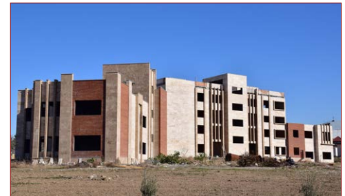
پروژه منابع طبیعی زیربنا: ۱۷۹۹۲ مترمربع پیشرفت فیزیکی در سال ۱۳۹۲: ۱۵٪ – سال ۱۳۹۹: ۷۵٪