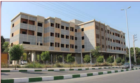
پروژه خوابگاه دانشجویی پسران زیربنا: ۳۳۳۵ مترمربع شروع: ۱۳۹۴ – پیشرفت فیزیکی در سال ۱۳۹۹: ۵۰٪