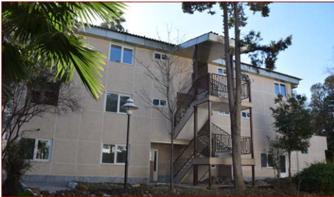
بازسازی بلوک ۲ خوابگاه دختران شروع: ۱۳۹۷ – اتمام: آذر ۱۳۹۹