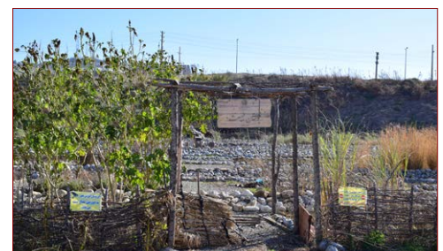
بوستان طبیعت (کلکسیون گیاهان مرتعی و دارویی) شروع: ۱۳۹۷ – پیشرفت فیزیکی در سال ۱۳۹۹: ۹۵٪