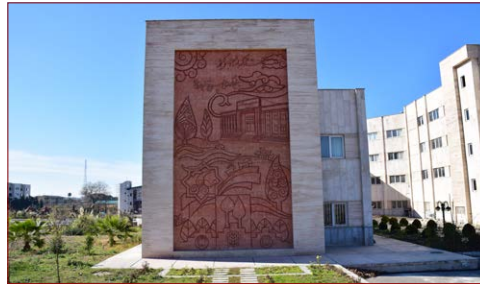
دیوار نگاره دانشگاه شروع: ۱۳۹۸ – بهره‌برداری: مهر ۱۳۹۹