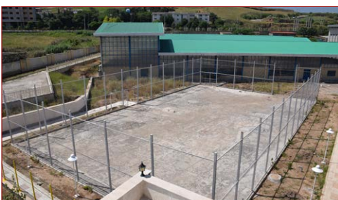
زمین ورزشی چندمنظوره مساحت: ۲۲×۳۷ مترمربع شروع: ۱۳۹۸ – پیشرفت فیزیکی در سال ۱۳۹۹: ۸۰٪