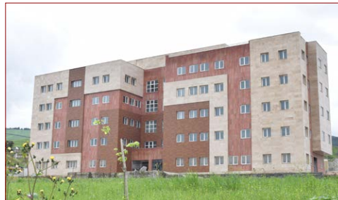
پروژه دانشکده جنگلداری زیربنا: ۵۰۰۰ مترمربع پیشرفت فیزیکی در سال ۱۳۹۲: ۵٪ – سال ۱۳۹۹: ۸۵٪