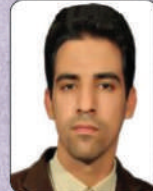
مهر دادباباربع دانشکده تولید گیاهی