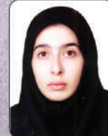
بیاتسیدالنگی دانشکده شیلات و محیط زیست