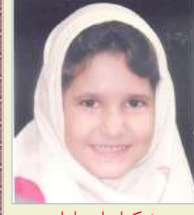
نیکتاساور علیا دوم ابتدایی معدل: خیلی خوب