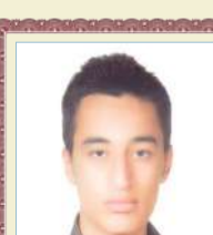
مظاهر نیک پیام قبولی دانشگاه دکتری