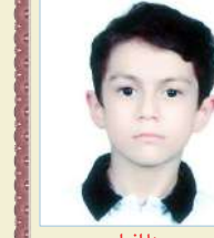
یونا افرا دوم ابتدایی معدل: خیلی خوب