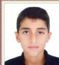
محراب کشیری دوم راهنمایی معدل: ۱۹/۷۹