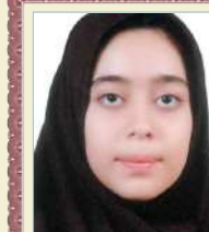
میبنا نیک پیام دوم راهنمایی معدل: ۱۹/۸۶