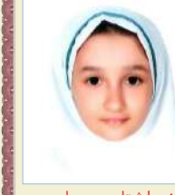
نجوا شتایی جویباری سوم ابتدایی معدل: خیلی خوب