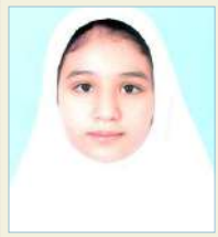
دابانا قدمان پنجم ابتدایی معدل: خیلی خوب