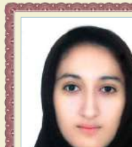
عطیه تراهی دوم دبیرستان معدل: ۱۸/۲۴