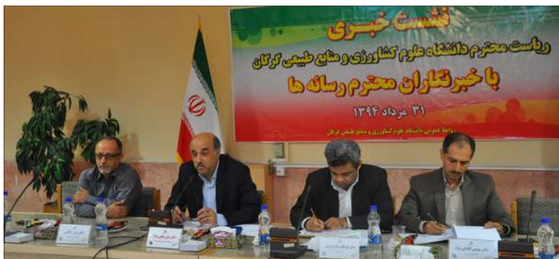
دکتر نجفی نژاد در جمع خبرنگاران: