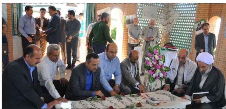
حجت‌الاسلام والمسلمین علی نامدار افزود: در زمان آغاز جنگ تحمیلی، توان نظامی چندان در

همچنین در حاشیه این مراسم نمایشگاه کتاب با موضوع دفاع مقدس توسط بسیج دانشجویی دانشگاه برپا شد.