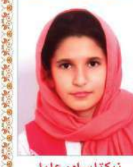
نیکناساور علیا سوم ابتدایی