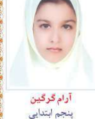
آرام گرگین پنجم ابتدایی