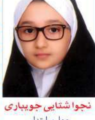
نجوا شتایی جوبباری چهارم ابتدایی