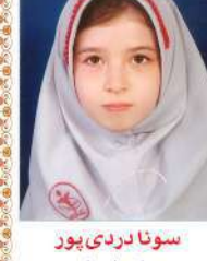
سونادردی پور چهارم ابتدایی